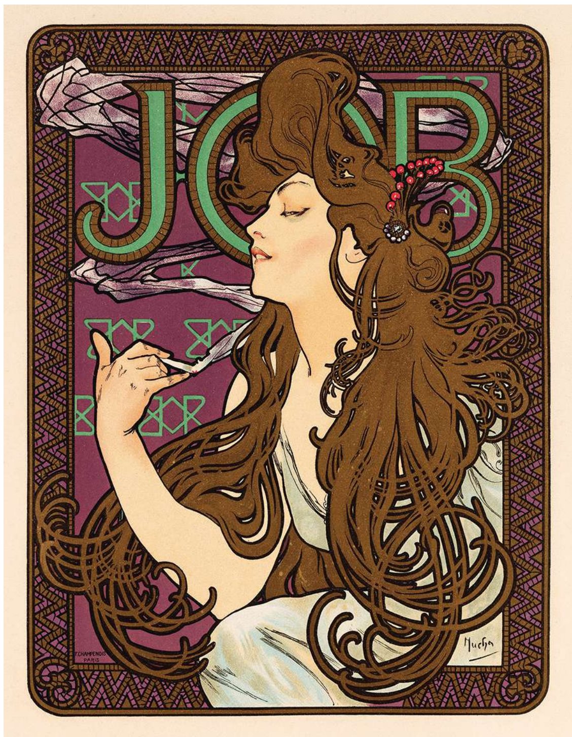
Affiche pour le papier à cigarettes Job (première impression en 1896), reproduite dans la publication mensuelle Les Maîtres de l'affiche (planche 202, février 1900). Lithographie en couleurs d'Alphonse Mucha, 40 x 29 cm. © MUCHA TRUST 2023