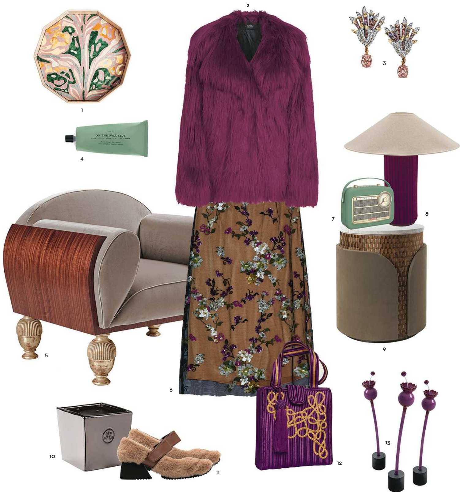
1/ Plateau Bortotto , design Zanellato & Bortotto, 2015 €. Del Savio 1910 sur Artemest.com 2/ Veste en fausse fourrure, 449 €. Karl Lagerfeld. 3/ Boucles d'oreilles en platine et en or jaune avec saphirs et diamants. Tiffany & Co. 4/ Masque-soin des cheveux, 200 ml, 32 €. On the Wild Side. 5/ Fauteuil Tan en bois de padouk, pieds dorés à la feuille et tapissé de velours, 10 370 €. Provasi. 6/ Jupe Begonia en tulle brodé de sequins, 550 €. Vince. 7/ Radio Bluetooth 130 en cuir, 160 €. NordMende sur Lebonmarche.com 8/ Lampe de table Mojave avec pied en céramique recouvert de tissu Kvadrat et abat-jour en lin, design Maryna Dague et Nathan Baraness, 343 €. Ligne Roset. 9/ Pouf-guéridon Alexia en nubuck, en bois et en marbre, à partir de 1 800 €. Stéphanie Coutas. 10/ Bougie parfumée Armagnac Ambré , 1,4 kg, 220 €. Amanda de Montal. 11/ Babies Diablo en fausse fourrure, 758 €. Paula Canovas del Vas. 12/ Sac à main Romi en tissu brodé, 720 €. Romi Loch Davis. 13/ Fleurs décoratives Flora en métal et en céramique émaillée, design Roberto Cambi, 413 € l'unité. Giorgetti.